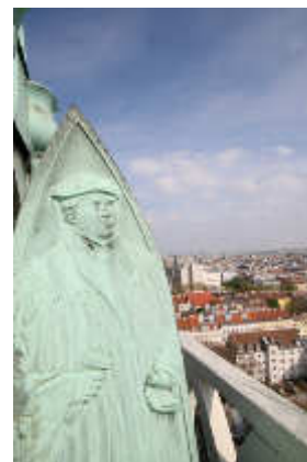
Lutherrelief am Turm der Lutherkirche